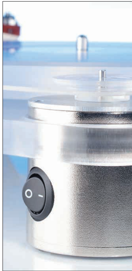
Massiv: Der laufruhige Motor des Emotion ist in dem externen Gehäuse aus Druckguss untergebracht.

In dieser Kombination kam der Emotion auch perfekt justiert zum Test und machte sogleich mit seiner lebendigen Spielweise auf sich aufmerksam. So drehte Jack Johnson bei „On An’ On“ herzerfrischend auf, wobei der Emotion der Gitarre einen glaubhaften Holzkorpus verlieh. Auch der gezupfte Kontrabass von „Tiden Bara Gar“ auf der Opus 3 Test Record 1 (siehe Plattentipps) war nicht nur schön druckvoll, sondern zudem locker gespielt und ebenfalls mit der richtigen Prise Holzklang versehen. Dass der Emotion ermöglichte, tief in den Aufnahmeraum hineinzuhören, und die Kongas so richtig frech schnalzen ließ, machte ihn den Testern äußerst sympathisch. So waren sie so sehr begeistert, dass sie die teurere hauseigene Konkurrenz antreten ließen, den Champion mit dem Tonarm OME 300 ST. Doch der wies mit besserer Abgrenzung ein-